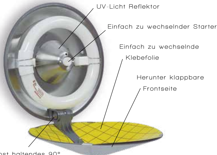
Selbst haltendes 90° Winkelscharnier